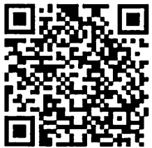
คู่มือสำหรับประชาชน งานการประกอบโรคศิลปะ