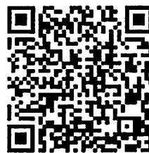
คู่มือสำหรับประชาชน งานคุ้มครองเด็กที่เกิดโดยอาศัยเทคโนโลยี ช่วยการเจริญพันธุ์ ทางการแพทย์