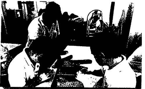
การเสริมสร้างพัฒนาการ (การใช้กล้ามเนื้อมัดเล็ก)