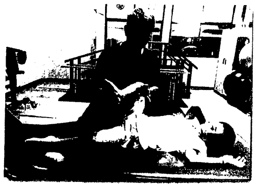
กายภาพบำบัด