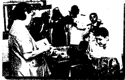
สมเด็จพระเทพรัตนราชสุดาฯ สยามบรมราชกุมารี เสด็จทอดพระเนตรกิจกรรมด้านอาชีพคนพิการทางสติปัญญา