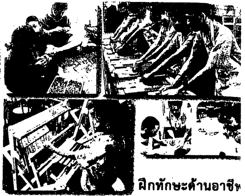
ฝึกทักษะด้านอาชีพ