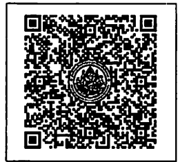
QR-Code เพื่อสมัครอบรม

โรงแรมรอยัลริเวอร์ ๒๑๙ ซอยจรัญสนิทวงศ์ ๖๖/๑ แขวงบางพลัด เขตบางพลัด กรุงเทพฯ ๑๐๗๐๐ โทรศัพท์: ๐๒-๕๒๒-๙๒๒๒ โทรสาร : ๐๒-๕๓๓-๕๘๘๐ E-mail : rsvn@royalriverhotel.com