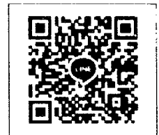
QR-Code เพื่อสอบถามข้อมูล