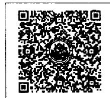
QR-Code เพื่อสมัครอบรม

โทรศัพท์ ๐-๒๑๐๕-๔๖๘๖ ต่อ ๑๐๐๒๖๖ โทรสาร ๐-๒๕๓๓-๔๙๓๘