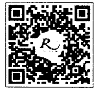
QR-Code สำหรับจองห้องพัก

โทรศัพท์: ๐๒-๔๓๒-๙๒๒๒ โทรสาร : ๐๒-๔๓๓-๕๘๘๐ E-mail : rsvn@royalriverhotel.com