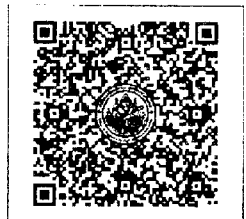
QR-Code เพื่อสมัครอบรม

ดาวน์โหลดรายละเอียดได้ที่ Website: www.thailocalsu.com