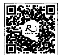
QR CODE สำหรับจองห้องพัก มหาวิทยาลัยศิลปากร

การสำรองห้องพัก ท่านสามารถจองห้องพักกับทางโรงแรมโดยสแกน QR-Code สำหรับจองห้องพัก หากท่านจองห้องพักภายหลังห้องพักอาจเต็มได้ และอาจไม่ได้ห้องพักราคาพิเศษ โรงแรมรอยัลริเวอร์ ๒๑๙ ซอยจรัญสนิทวงศ์ ๖๖/๑ แขวงบางพลัด เขตบางพลัด กรุงเทพฯ ๑๐๗๐๐ โทรศัพท์: ๐๒-๔๒๒-๕๒๒๒ โทรสาร : ๐๒-๔๓๓-๕๘๘๐ E-mail : rsvn@royalriverhotel.com