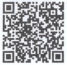
สิ่งที่ส่งมาด้วย ๑ และ ๒