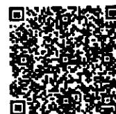
สิ่งที่ส่งมาด้วย ๑ ประกาศหลักเกณฑ์ฯ

รองประธานกรรมการบริหารมูลนิธิศาสตราจารย์ปกรณ์ อังศุสิงห์ รักษาการแทน ประธานกรรมการบริหารมูลนิธิศาสตราจารย์ปกรณ์ อังศุสิงห์