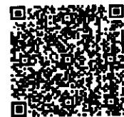
สิ่งที่ส่งมาด้วย ๒ แบบกรอกข้อมูล

ร.ป. มณฑล... 1560 พง.อ.บ.ส. เพื่อโปรดพิจารณาโดยด่วน กปม. พ.ศ.